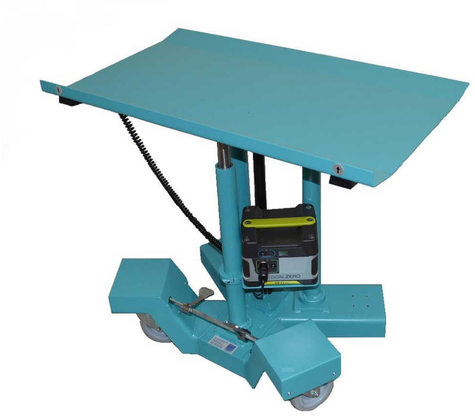
THW 3S EB T100